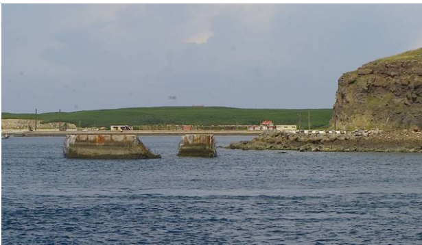
圖的海中有一破裂建物，即為剛拆除一半的橋墩。

停留將軍島時間真的不夠，還有許多美麗的海水區域和人文風光來不及慢慢欣賞，就得回本島了！出發時，看到縣府花了幾億元卻失敗而正在拆除的望安-將軍橋樑的橋墩，相對政府官員喊窮的模樣，實在諷刺！