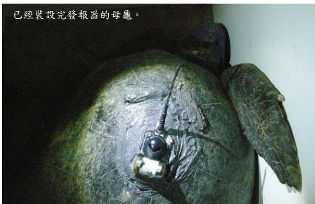
已經裝設完發報器的母龜。

因為眾人太過興奮，加上明月、星星和月暈太美，於是開始有幻象出現。此時有一飛行器飛行路線不尋常，於是就越來越多人呼應「飛碟」出現，越接近我們時，還嚷著誰快要被抓去研究了。直到 00:00 母龜終於完成工作開始爬回海裡時，研究人員將他用長方形木櫃框住，開始裝設發報器的程序。期間，非常疲累、急著回到海洋的母龜，因為不舒服和被控制許久無法活動而生氣努力掙扎。生氣動作包括：四隻揮動噴出許多沙子、口鼻處發出很大的氣聲、抬頭轉身等，可以看出其憤怒的情緒。