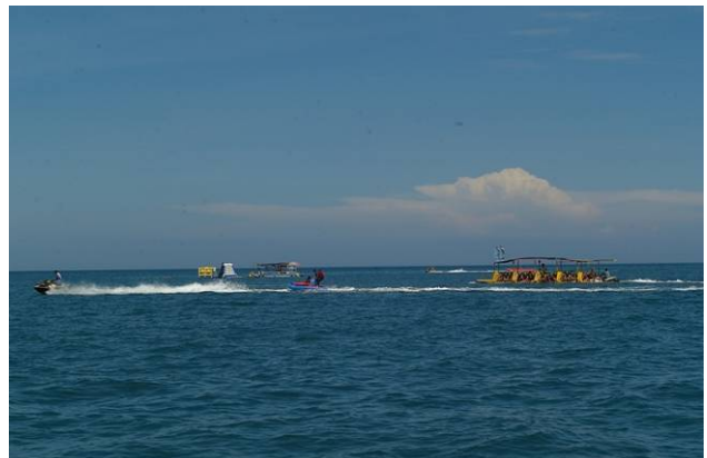
吉貝嶼的水上活動。

繼續往北，來到吉貝嶼，若非我要拍吉貝的沙嘴，有志喜愛悠閒、寧靜的地方，是不想到有遊客的島嶼的。吉貝發展觀光，許多載遊客體驗珊瑚和浮潛的船隻來來往往，有速度快穿梭其間的水上摩托車呼嘯載美麗沙嘴海域，的確是蠻煞風景的。