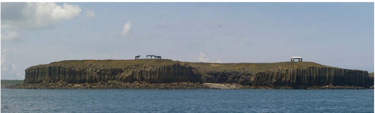
小門海岸的柱狀玄武岩相當壯觀。

回到高雄後，儘管皮膚曬黑、發熱、又癢又痛的，但昨晚還夢見澎湖玩水的情景哩。美麗的島嶼、澄清透徹的海水、貝殼沙灘、珊瑚礁生態和綠蠵龜，「不跳下水游泳是對澎湖海水的大不敬啊！」