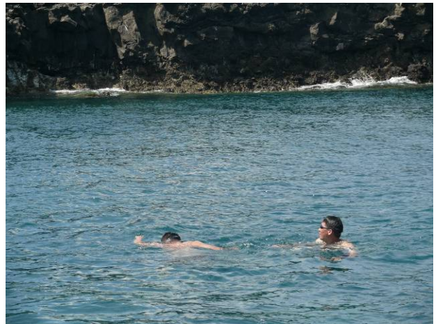
受不了大海的呼喚，不跳下來不只對不起大海，更對不起自己。

嶼全島周邊都是柱狀玄武岩外露的崖壁，造型特殊。一接近，許多的燕鷗就群起飛起，相當壯觀。清澈的海水、雄偉的玄武岩海蝕洞，又讓我二人跳下游泳去。這裡的海底也有一些珊瑚生長，但植株較小、覆蓋率也不高，希望未來珊瑚能越來越生命蓬勃。而令人驚喜的是，這裡有許多丁香魚和其他小型或珊瑚礁魚類，當你游泳時，曾經歷過身體被廣大魚群環繞，你就會了解我的感動！