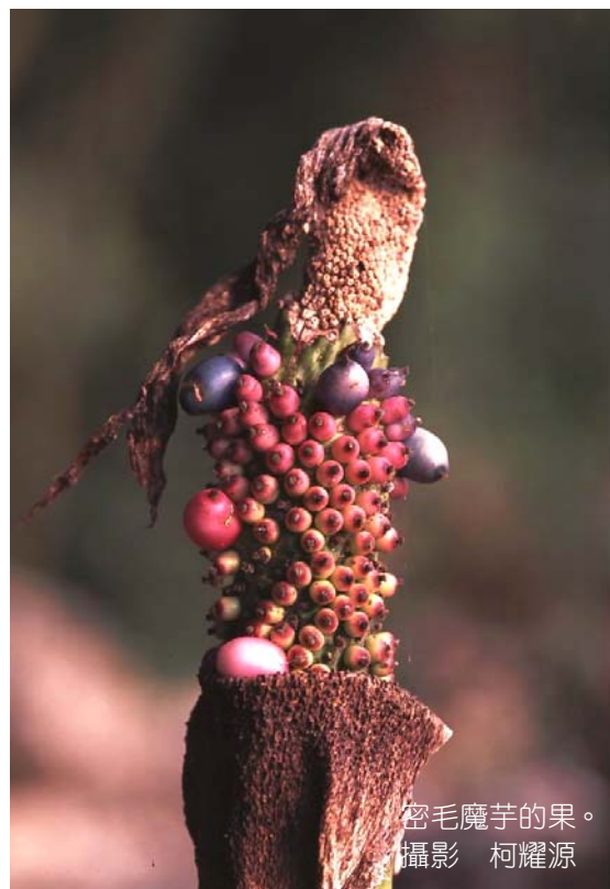
密毛魔芋的果。

魔芋，這最臭美的花，對某些生物有致命的吸引力，卻也因臭而招致死亡的命運。有些不瞭解魔芋特殊、珍貴的人，可