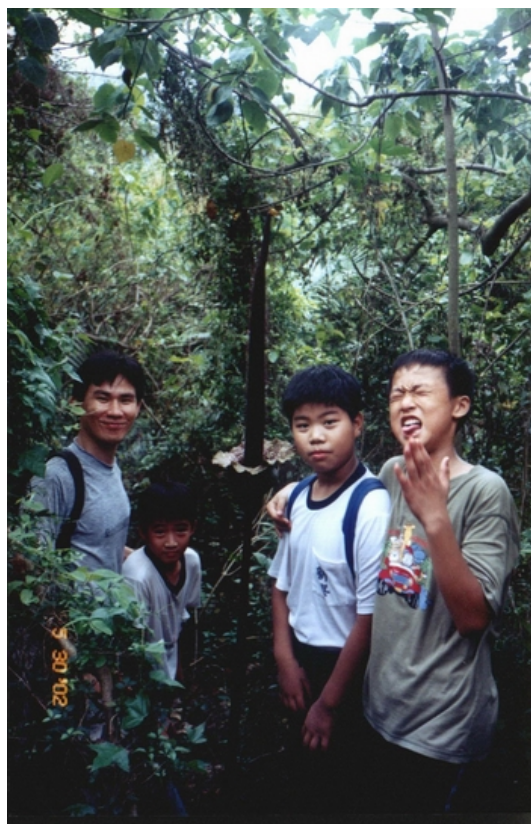
學生既興奮，又臭得受不了的與魔芋花合照。

珍惜和尊重嗎？高雄人有幸擁有她，能不好好認識她嗎？我深深地期待每年春雷乍響，梅雨來臨時，咱們高雄人會想起魔芋，也會起身前往拜訪、親近，甚至以「魔芋祭」來歌詠她。到時候，高雄市民將知道柴山不只是人們來運動的山，而是有豐富內涵，且擁有國家級保育動植物生長的山！也許，本土化就從這裡出發，形成市民意識，哪天在外地與人談起，我們會說：「柴山是阮高雄人的驕傲」，這樣的口號，不是只有宜蘭人能，我們高雄也做得到。也或許不久的將來，高雄的學校驪歌響起時，魔芋花開將成為畢業時節，大自然對咱們高雄子弟最重要、最深切的祝福與期待了！