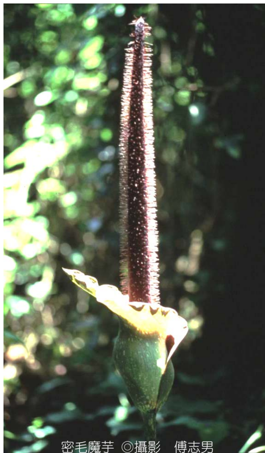
密毛魔芋

魔芋的花是最受人矚目的（魔芋開花時不長葉，長葉時不開花），魔芋的花包含花柄、佛焰苞和其上的附屬物三個部分，長得像古代武士的長柄槍（長長的花柄頂端有一佛焰苞）。一棵台灣魔芋通常可以每年都開一次花，因為其花柄短，花高大都在30到50公分左右，60公分以上者比較少見。密毛魔芋則是一年長葉，一年開花，為的是儲存更多的營養，以完成隔年傳宗接代的重要任務。至於花高則比台灣魔芋